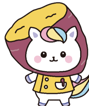
「看護の日」キャラクター 埼玉県 かんごちゃん