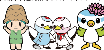
蓮田市商工会 人間総合科学大学 @蓮田市

※この公開講座は、令和3年3月に蓮田市・蓮田市商工会と本学との三者で締結しました、「防災・減災・災害対策等リスクマネジメントの連携協力に関する協定」に基づき開催いたします。 ※講演テーマ・内容は一部変更となる場合がございます。